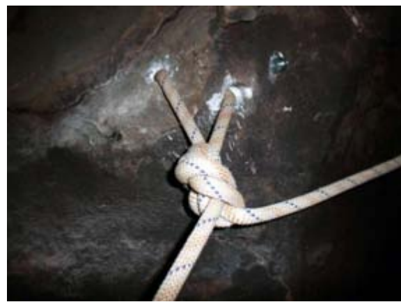
Ilustración 7 Abalakov, falta un cordino para dejar bien la instalación.