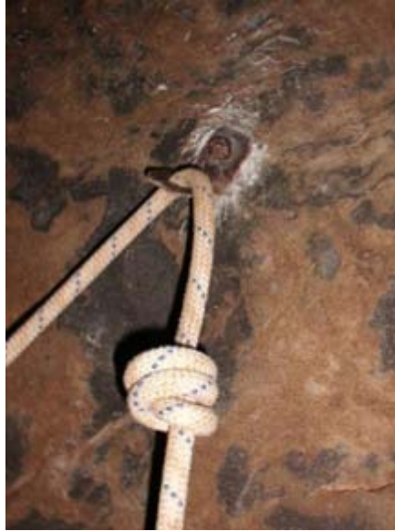
Ilustración 4 Final del último pasamanos del gours

En total se han empleado 21 anclajes químicos y 8 Abalakov. Se han cambiado un total de 140 m de cuerda. Llama la atención la fragilidad de los tornillos y chapas viejas que se han desequipado.