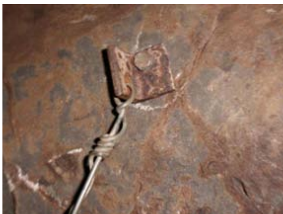
Ilustración 6 Cable en el pasamanos final de la galería de los gours.