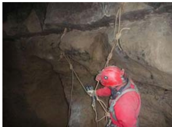
Ilustración 9 Cabecera del E18, pozo muy comentado por su fraccionamiento deteriorado.