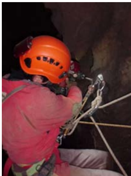
Ilustración 5 Taladrando en el pasamanos del gours.

El trabajo ha sido arduo para los dos grupos compuestos de 3 personas que han hecho vivac dentro de la cueva desde el viernes 1 al domingo 3. Han quedado muchas cosas pendientes, ya que se dio prioridad a los puntos más arriesgados. El tobogán o el tramo inicial de los pasamanos (en sentido caballos – valle) de los gours están en mal estado. Hay que cambiar algunas cuerdas más e incluso algún anclaje.