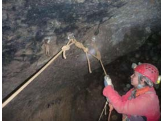
Ilustración 10 cabecera del E5. Falta por renovar anclajes y cuerdas.