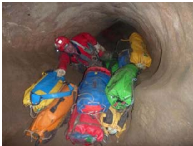
Ilustración 3 Pasando sacas por la Canal.

Para los cambios de cuerda, se ha preferido usar cuerda en buen estado, pero no nueva, para usar cuerda consolidada.