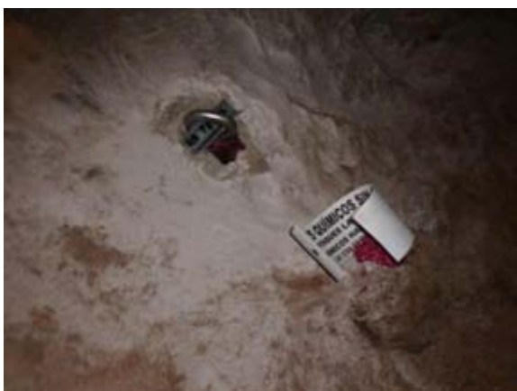
Ilustración 11 Cartel de aviso y resina testigo.