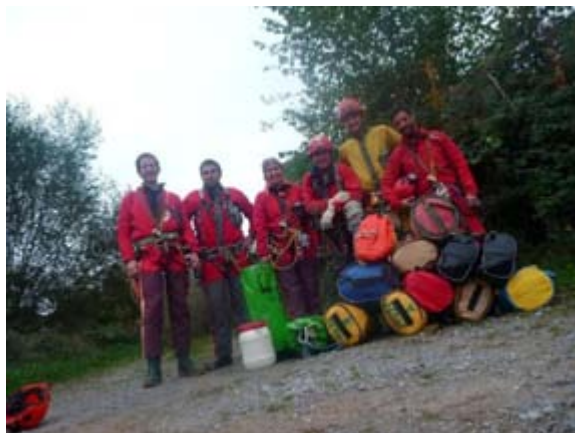
Ilustración 1 Equipo instalador.

Esta reinstalación se llevó a cabo desde el día 1 al 3 de noviembre del 2013, por un equipo de seis personas pertenecientes a la Federación Madrileña de Espeleología, quienes se han encargado de los trabajos.