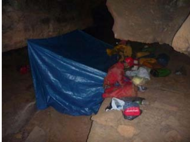
Ilustración 2 Campamento en la galería lógica.

Para llevar a cabo estos objetivos, se decidió montar un vivac dentro de la cavidad durante 2 días cerca de la galería lógica, lo que nos permitió aprovechar más el tiempo y la efectividad de los trabajos a realizar.